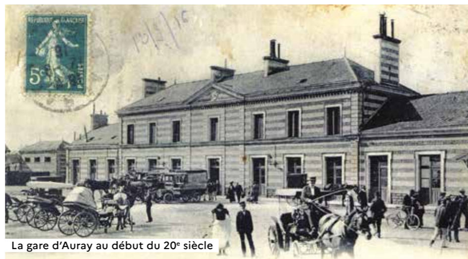
La gare d'Auray au début du 20 e siècle