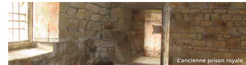
L'ancienne prison royale

→ Trajet : 21,5 km → Retour avec navettes gratuites à partir de 14h30 au départ de Carnac → Inscription obligatoire sur www.lescirculaires.fr ou lescirculaires2024@gmail.com → Organisé par Auray Quiberon Terre Atlantique