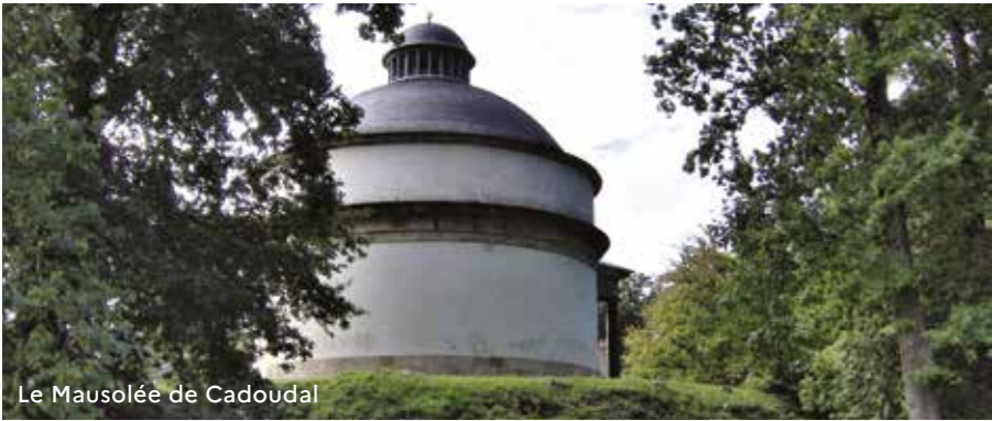
Le Mausolée de Cadoudal