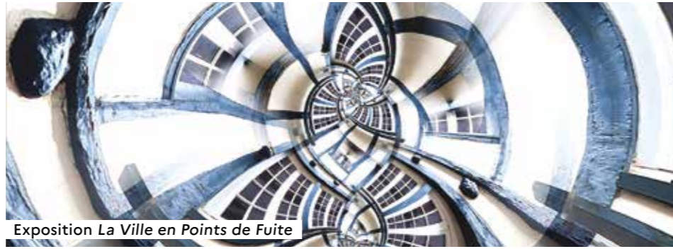
Exposition La Ville en Points de Fuite

En 1823, les Bretons du Morbihan décident de consacrer un mausolée à la mémoire de Georges Cadoudal, chef de la chouannerie bretonne né à Kerléano, et de son compagnon d'armes, Mercier la Vendée. L'ouvrage de style néo-classique est classé au titre des Monuments historiques, en particulier pour ses terrasses et son escalier central.