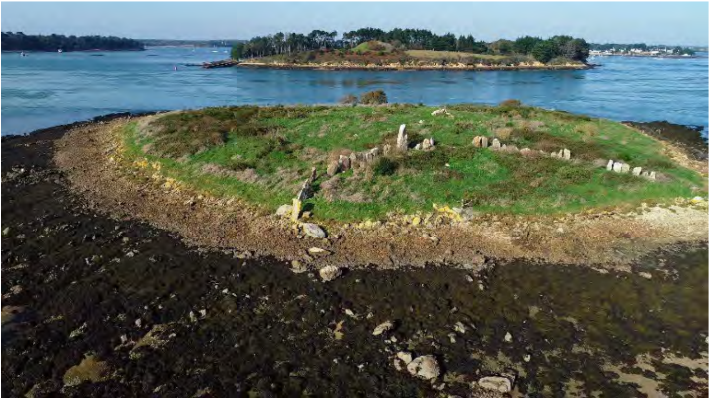
L'îlot d'Er Lannic et le cairn de Gavrinis (Larmor-Baden).