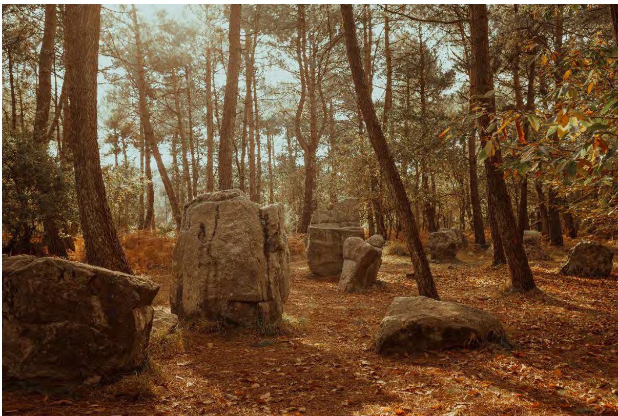
Alignements de Kerzerho – Coët Er Blei à Erdeven

Conçu par les médiateurs du patrimoine du conseil départemental du Morbihan et en collaboration avec les enseignants partenaires, ce dossier pédagogique est un outil documentaire pour préparer ou prolonger la découverte de l'exposition avec votre classe. Il présente le contenu de l'exposition, des ressources en lien et des pistes d'exploitation en classe en amont ou après la visite.