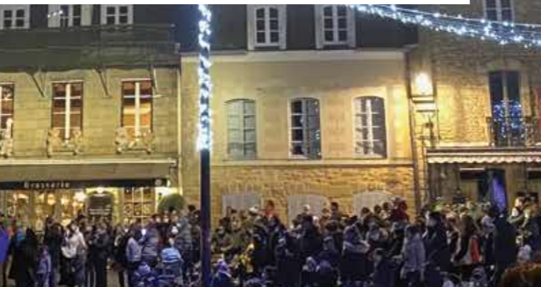
Arrivée du Père Noël - Décembre 2021