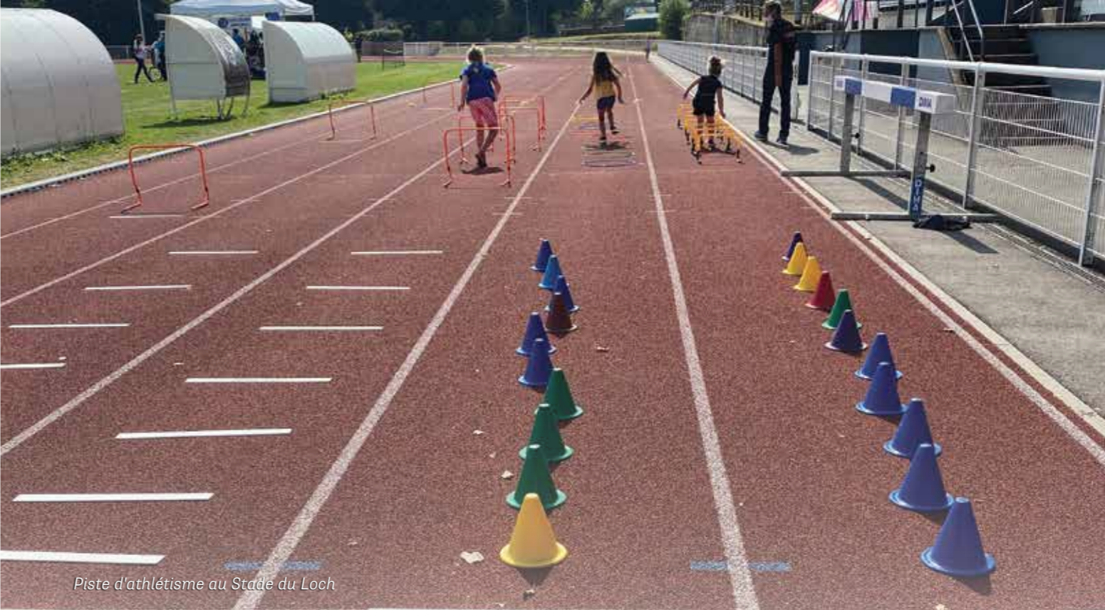
Piste d'athlétisme au Stade du Loch