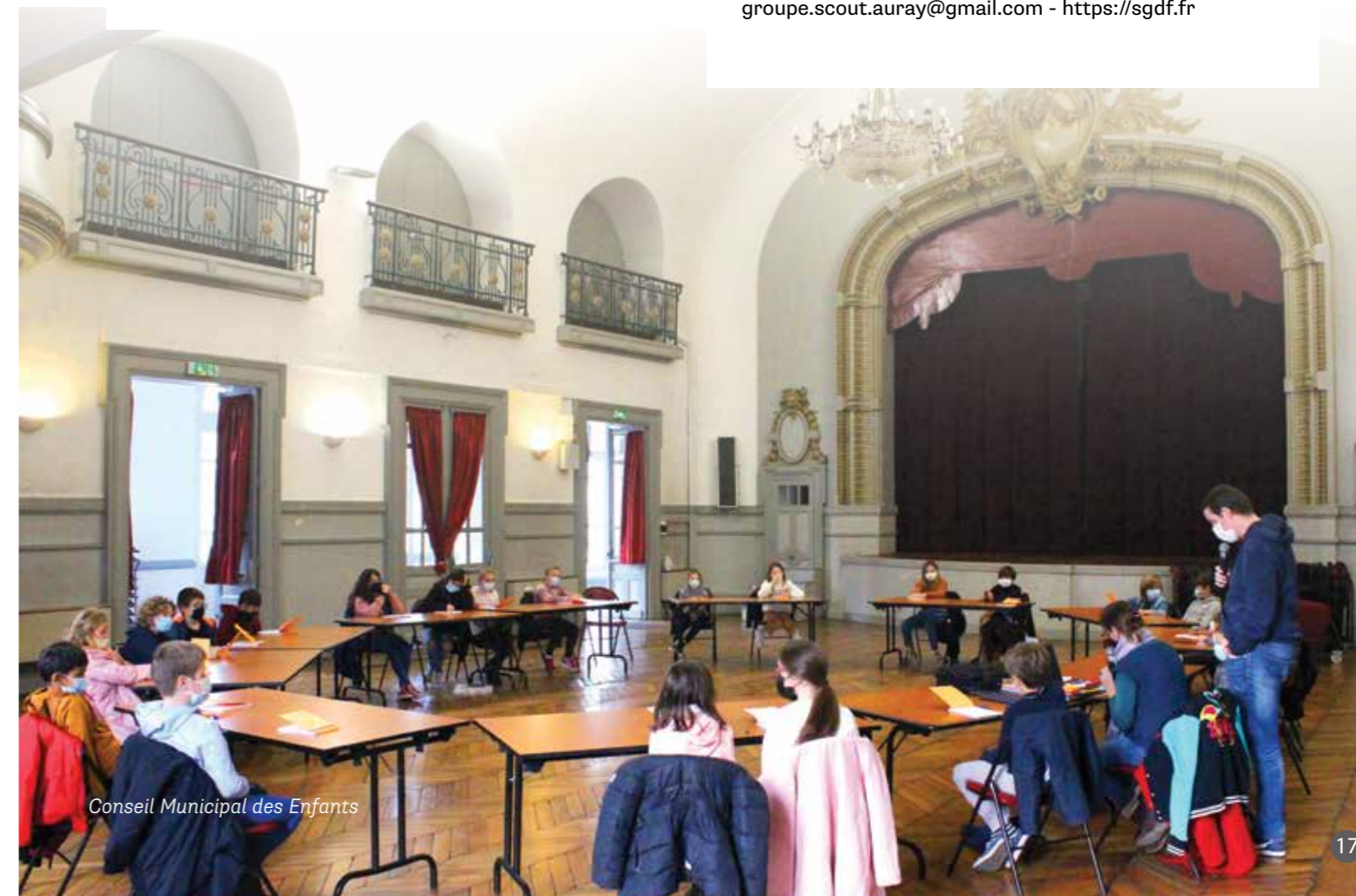
Conseil Municipal des Enfants

Président : Hervé PLANCHARD Contact : Christophe COMBRISSE 1 rue du Stade - 56950 CRAC'H groupe.scout.auray@gmail.com - https://sgdf.fr