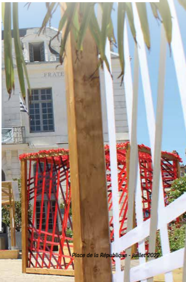
Place de la République - juillet 2022

20 rue du Colonel Faure 07 64 86 85 98 - 02 56 54 02 61 m.piauly@ville-auray.fr