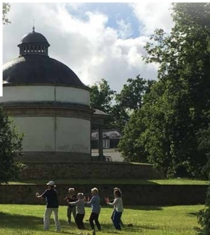
Mausolée de Cadoudal - Parc Cadoudal

Gouvernance collégiale 7 rue du Lévenant - 56400 AURAY shapa.auray@gmail.com www.shapa-auray.fr