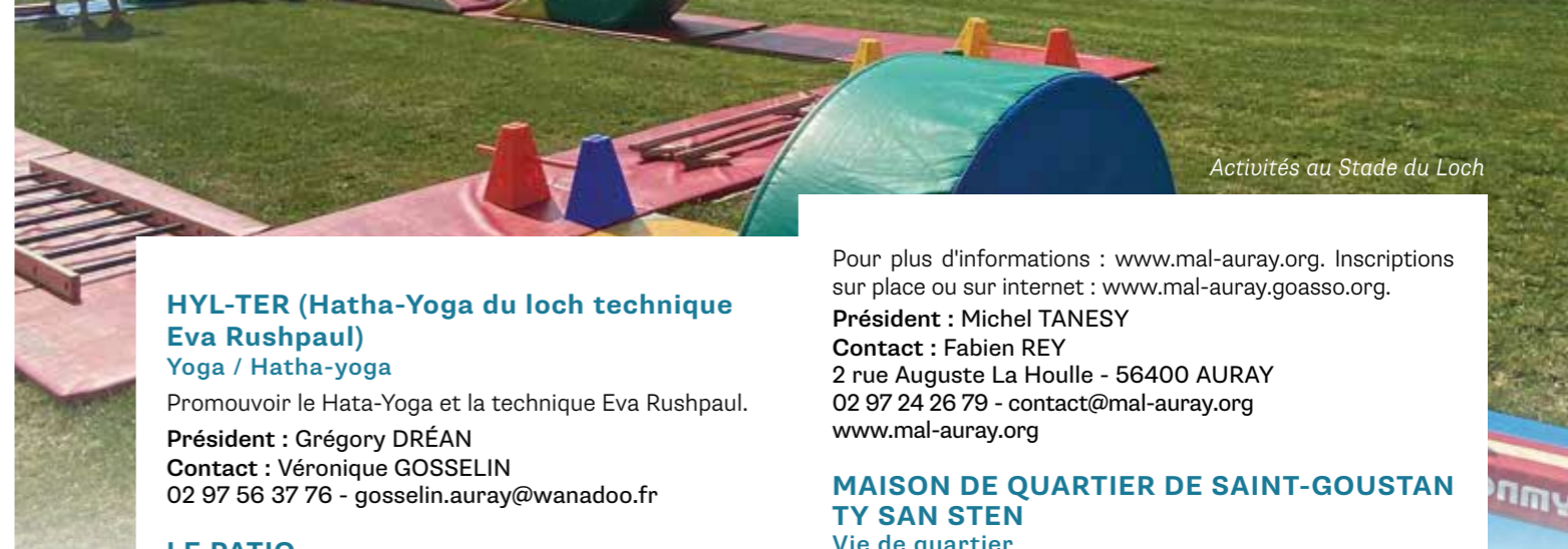
Activités au Stade du Loch